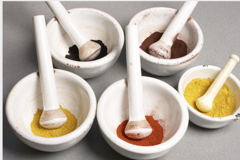
Неорганические пигменты (землистые оттенки, минеральные)