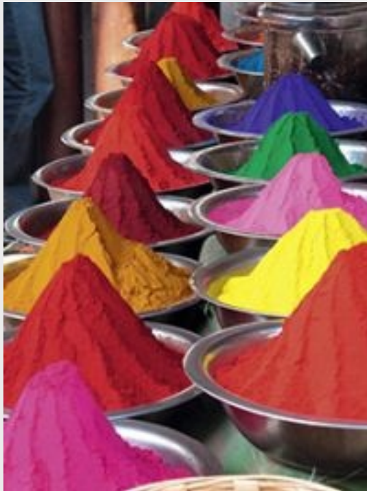
Органические пигменты (синтетические)